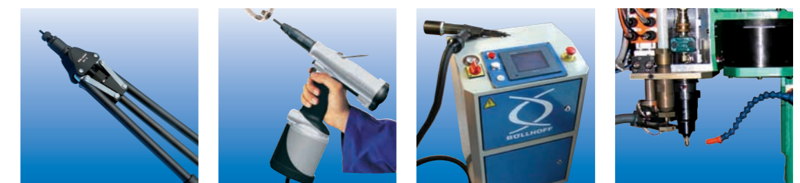
Apparecchi di posa manuale

BÖLLHOFF fornisce una vasta gamma di soluzioni di assemblaggio. Per conoscere e scegliere l'attrezzatura più idonea alle vostre esigenze di applicazione contattate il nostro servizio clienti.